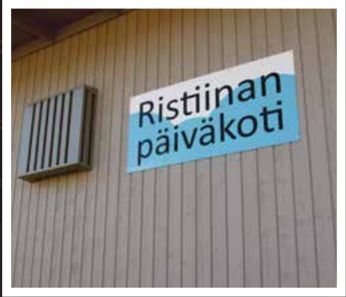
Ristiinan uusi päiväkotii oli yksi vuoden 2023 merkittävimmistä investoinneista.